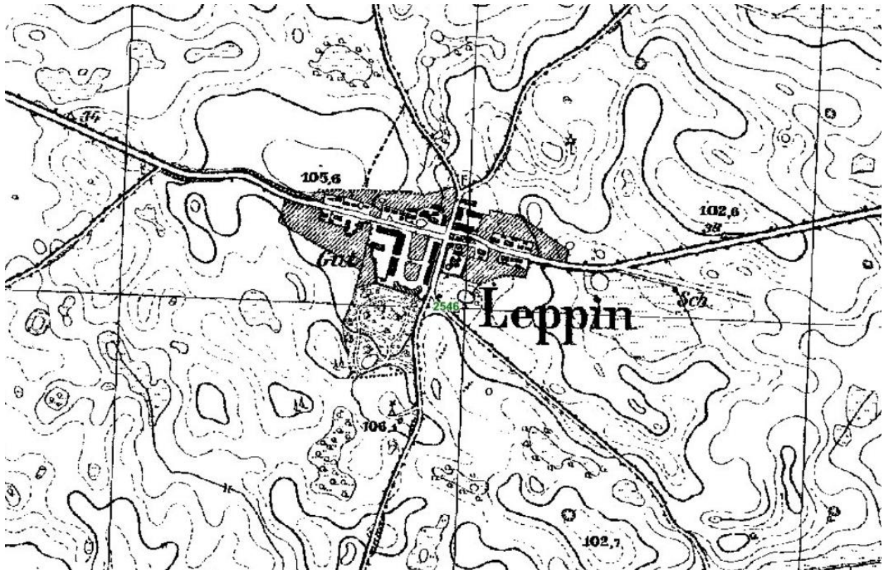
Historische Karte um 1900

Leppin ist siedlungshistorisch ein Gutsdorf. Historische Karten zeigen eine strukturelle Gliederung in den „Gutsbereich“ und den „Wohnbereich“.