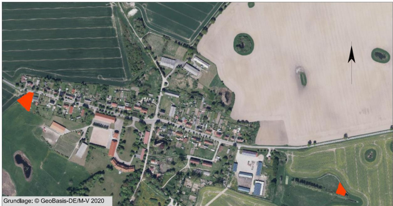
Lage der Kompensationsmaßnahme