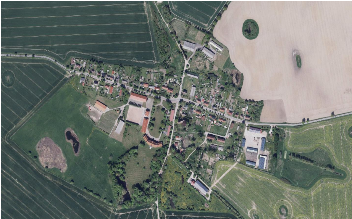
Luftbild der Ortslage Leppin in der Gemeinde Lindetal

Das aktuelle Luftbild zeigt die baustrukturelle Gesamtsituation. Die kompakte Ortslage ist durch gleichmäßige Bau- und Nutzungsstrukturen geprägt, die sich v.a. entlang der beiden Hupterschließungsstraßen entfalten.