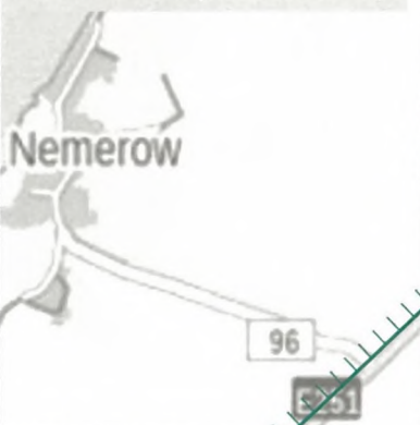
LSG vor Ausgliederung