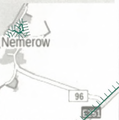
LSG nach Ausgliederung